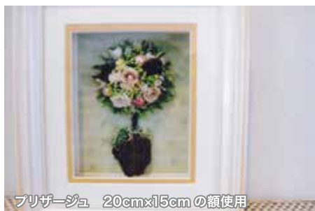
プリサージュ 20cmx15cmの額使用