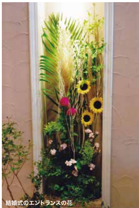
結婚式のエントランスの花

アートフラワー、プリザーブドフラワー等の作品は、日本の生活事情では、飾るスペースに悩まされているひとも多いのが実情です。そこで、平面、又は立体的な作品は額に入れ、壁に飾る、たとえば、絵画、宝飾品、身の周りのアクセサリー、鉛、アルミ、ドライ製品等、プリザーブドとコラボして、自由な発想で、製作、額に入れて飾るとほこりもつかず、アレンジに比べて傷みも少なく、長持ちします。ギフトとしても最適です。壁面を素敵な作品で飾れば部屋のインテリアにもなります。写真の作品は二十センチ×十五センチの額に入ってます。