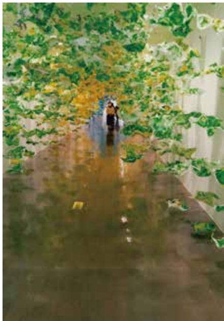
▲ここから歩き始め

皆様が花展を開くとき、天井があいているので、小さいバージョンで、考えてみてはいかがでしょうか。まだまだ、新型コロナウイルス感染予防対策に注意をして、行きたいと思います。