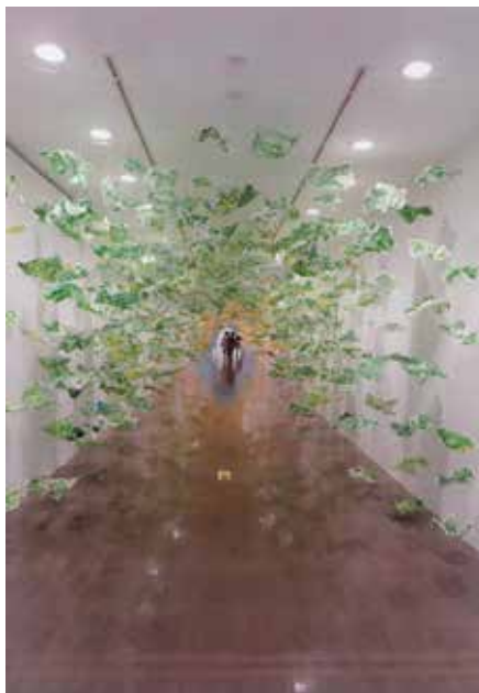
▲中間風と風鈴の音