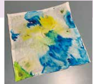
▲四角形の和紙見本

時折風鈴のやさしい音と風、何度でも、歩きたくなりました。動画でないのが残念です。ちなみにNHK朝ドラちむどんどの、オープニン